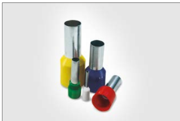
Terminal pino tubular (ilhós) simples isolado.