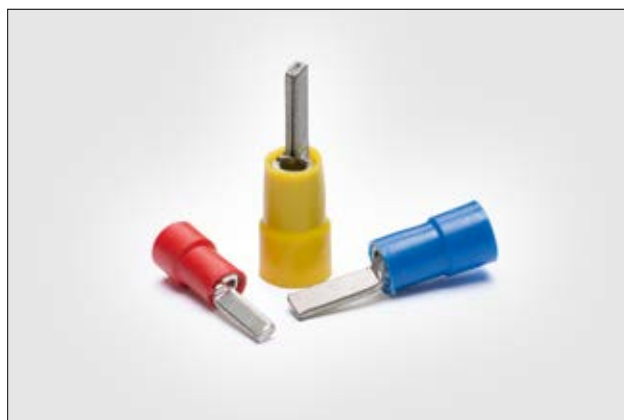
Terminal pino isolado.