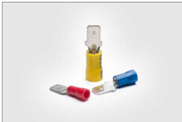
Terminal macho isolado.