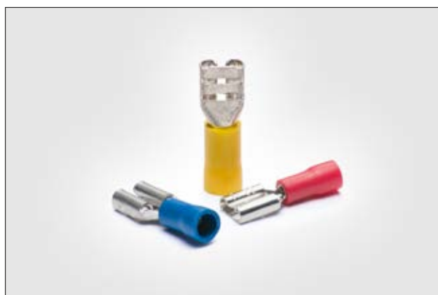
Terminal fêmea isolado.