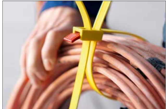
O excesso da fita pode ser perfeitamente alocado no alojamento da cabeça.