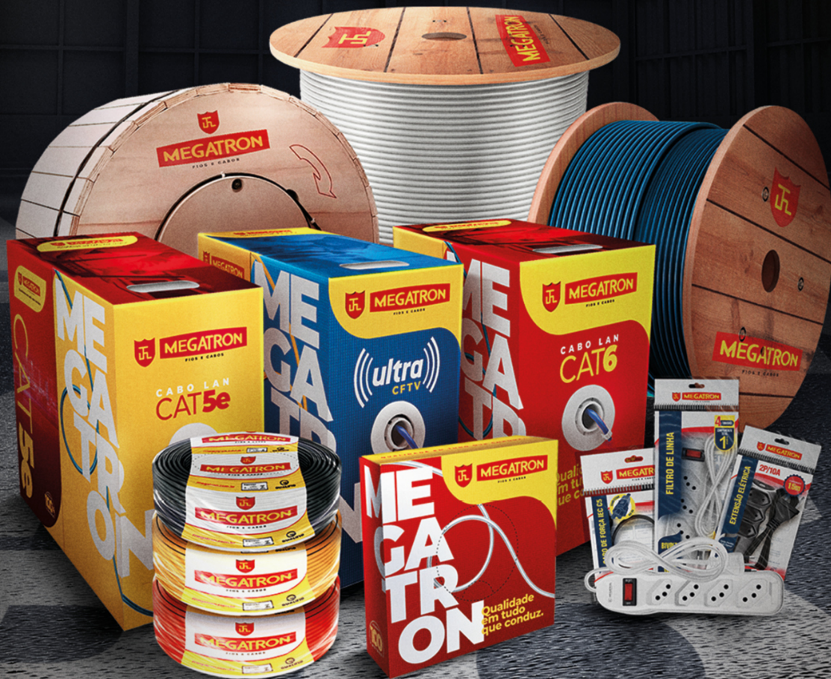
TABELA do eletricista